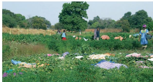
Grønnsakshagen i Sutukoba

Vi spiser frokost på hotellet før innsjekk. Flyet har avgang kl. 09.10 og lander på Gardermoen kl. 12.15.