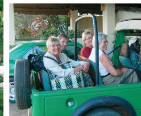
Taxi til markedet . . .