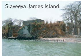
Slaveøya James Island

Vi tar forbehold om endringer i programmet.